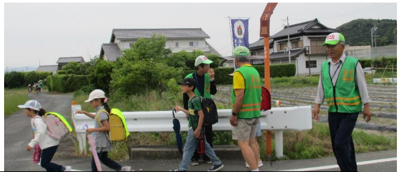
暑い日も、雨の日も、毎日一人一人を見守り、安全を気にかけてくださるボランティアの皆さん